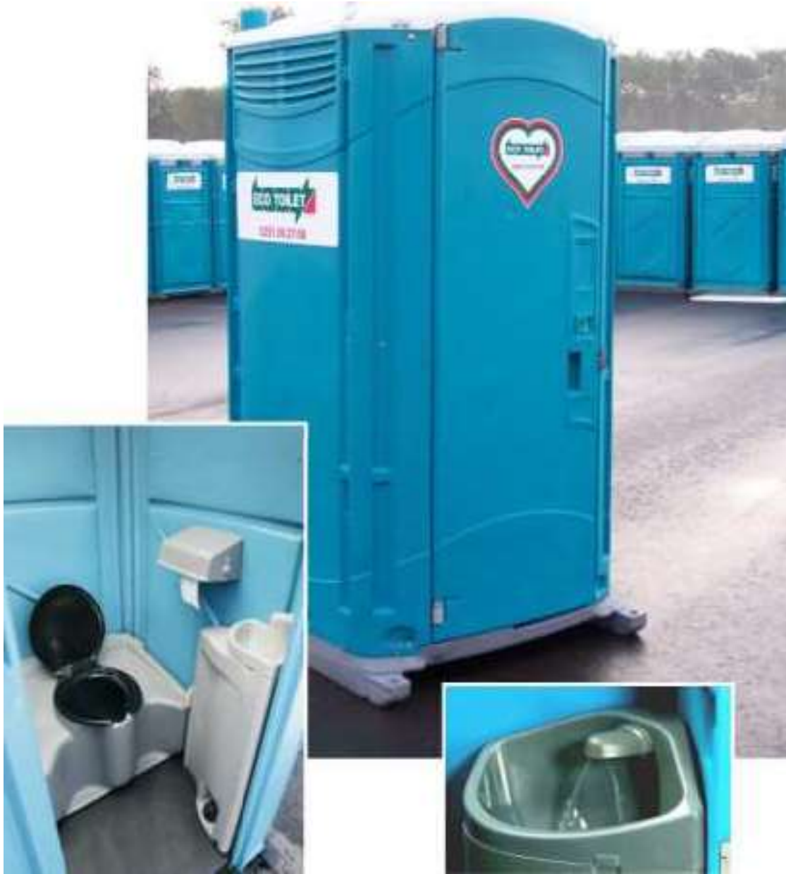
Mobiele toiletten, met wasbak en closetpot of urinoir en wasbak